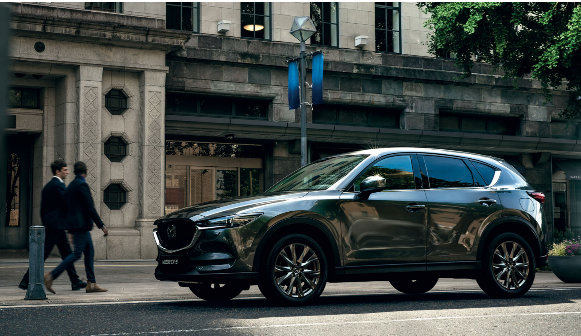
Der Mazda CX-5 Takumi Plus