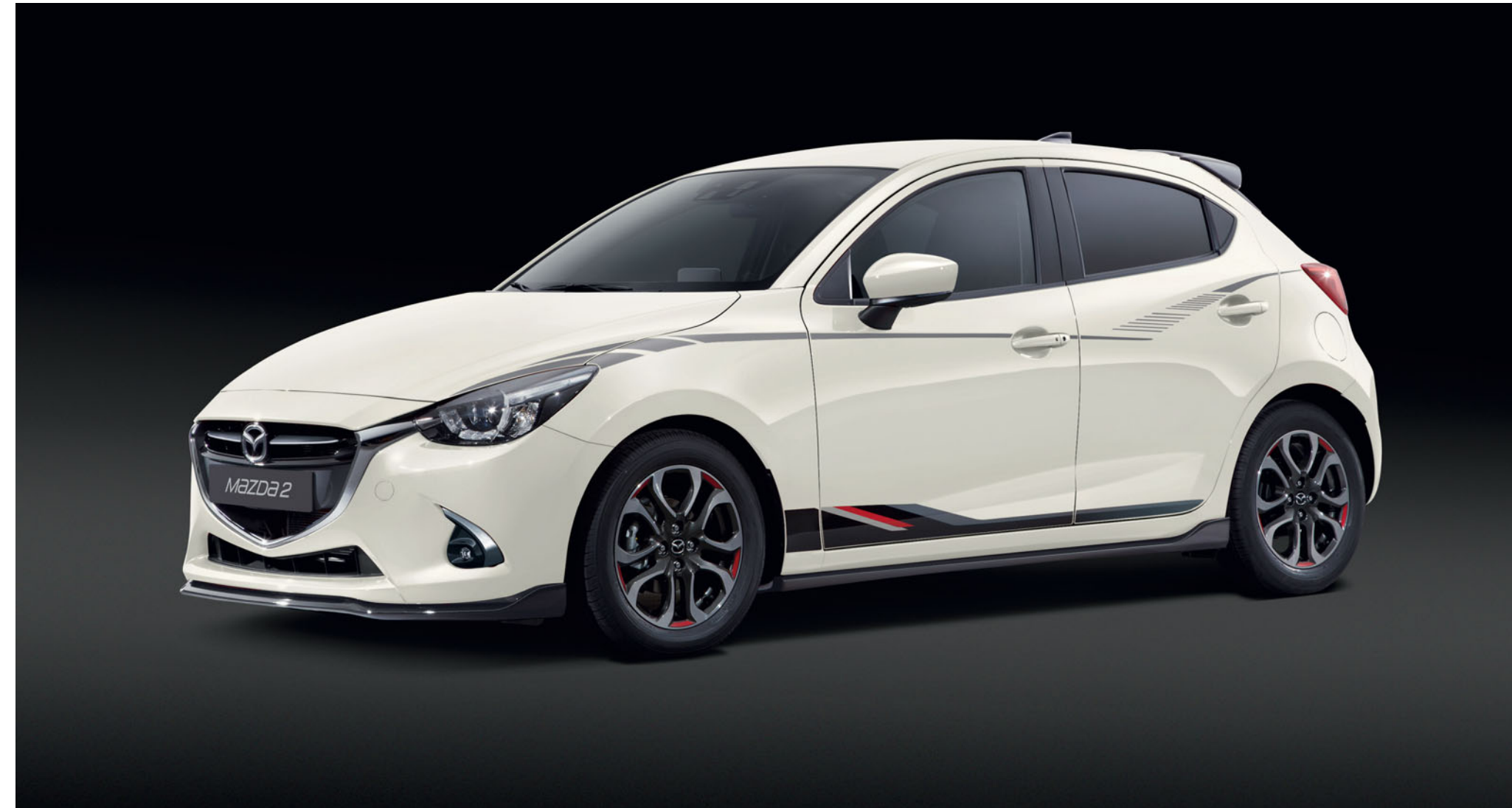
Frontschürzenlippe und Seitenschweller in Brilliant Black