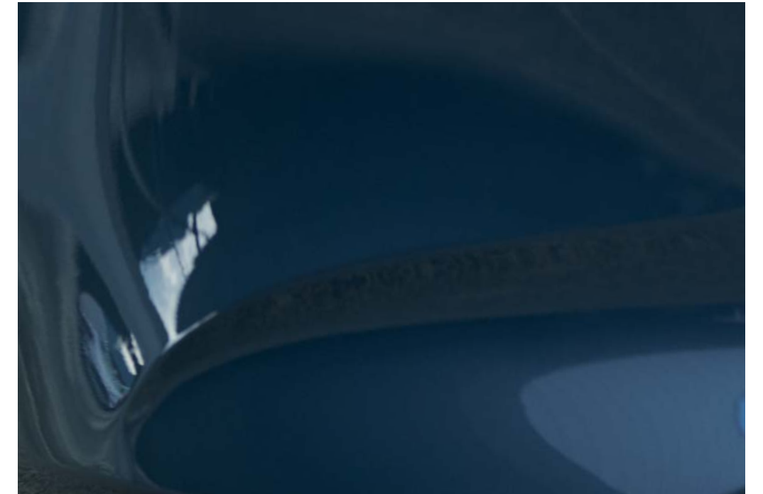
Polymetal Grau Metallic