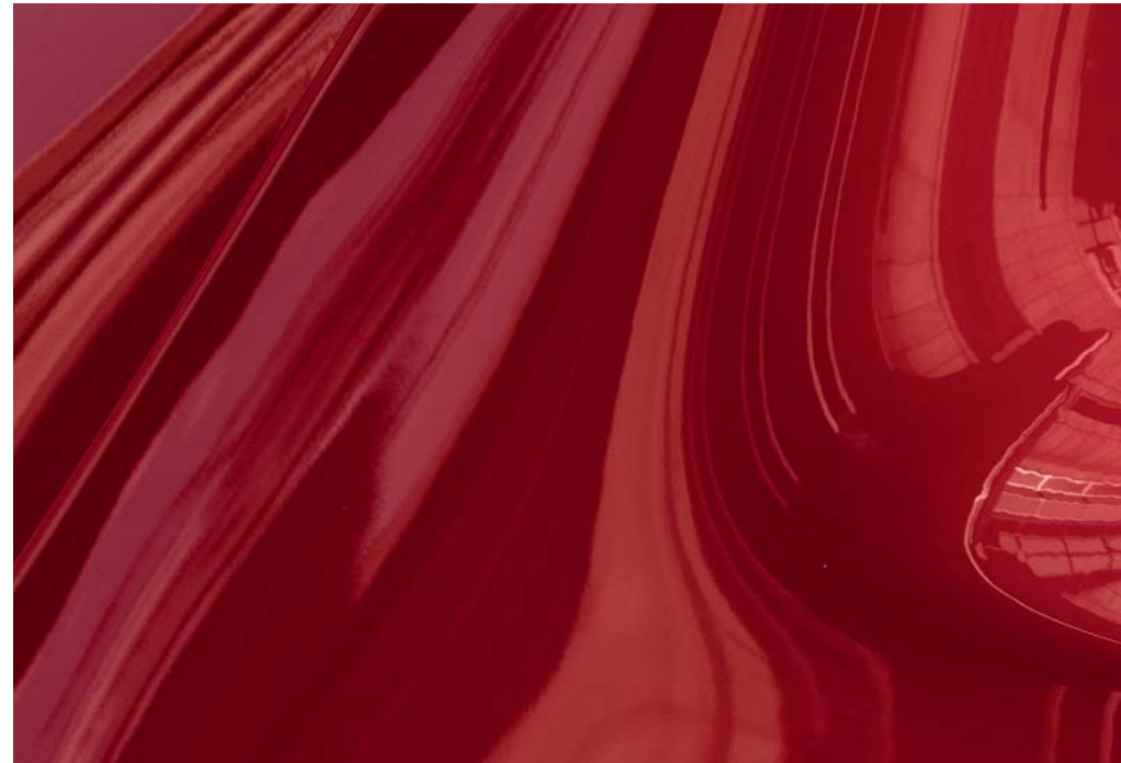
Crystal Soul Rot