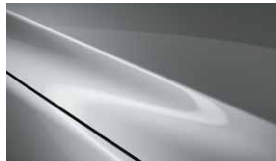
Sonic Silber (45P)