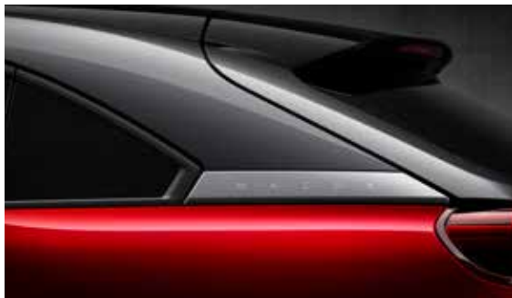
3-Ton Metallic Crystal Soul Rot (47E)

Preise gültig für alle Kaufverträge ab 01.07.2020. Diese Preisliste löst alle bisherigen Mazda Neuwagenpreislisten ab. Alle Angaben in dieser Preisliste sind unverbindlich und vorbehaltlich Druckfehler.