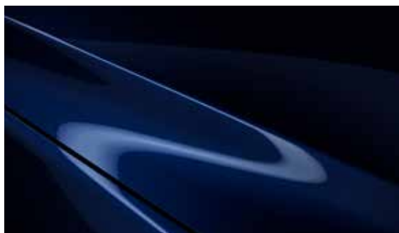
Deep Crystal Blau (42M)