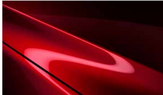
Crystal Soul Rot (46V)