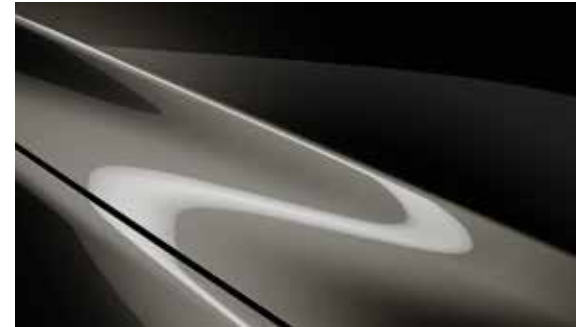
Titanium Flash (42S)