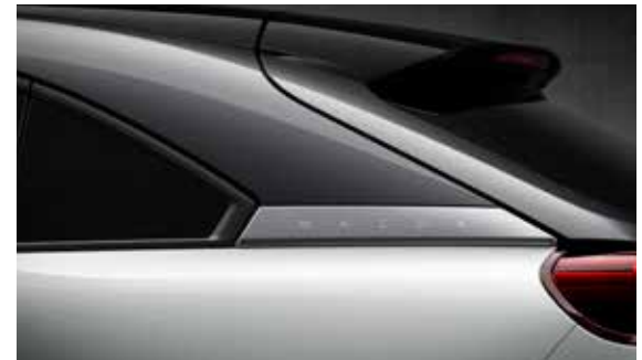
3-Ton Ceramic Metallic (48A)