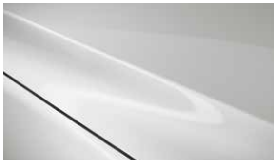
Snowflake Weiß (25D)