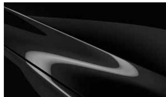
Jet Schwarz (41W)