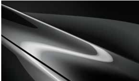
Machine Grau (46G)