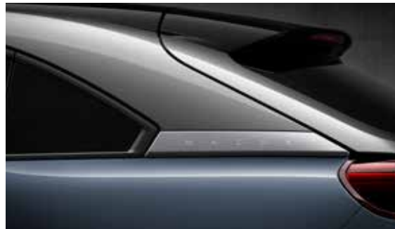
3-Ton Metallic Polymetal Grau (47L)