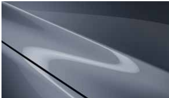
Polymetal Grau (47C)