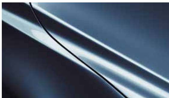
Eternal Blau (45B)