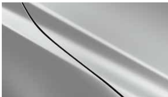
Ceramic Silber (47A)