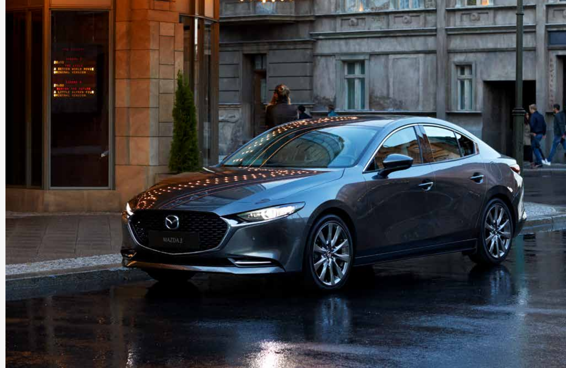
MAZDA 3 SEDAN