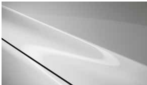
Arctic Weiß (A4D)